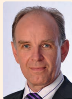
Ralf Meister, Bischof der Ev.-luth. Landeskirche Hannovers