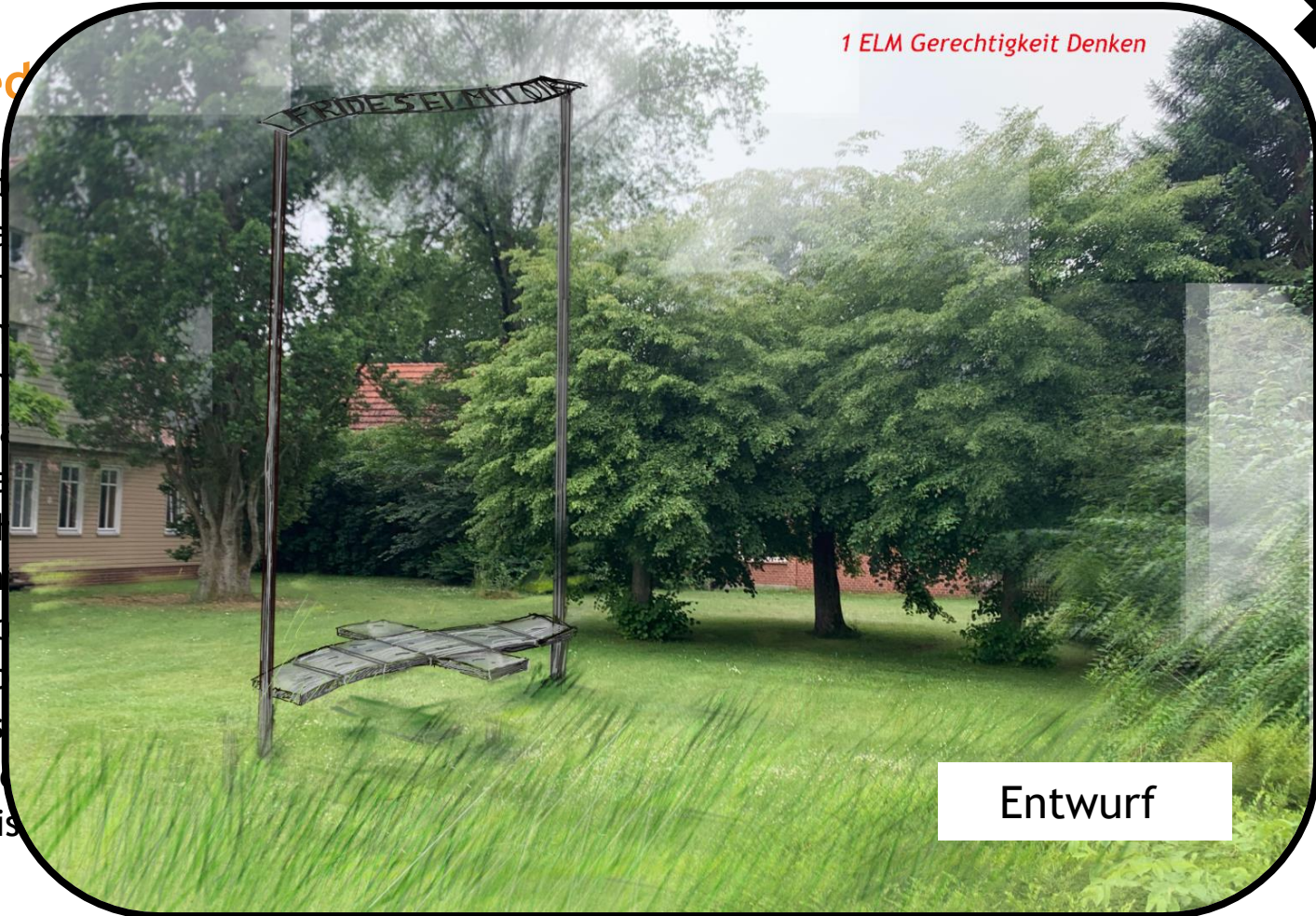
1 ELM Gerechtigkeit Denken

Jed Wla den Kon dar inh Wie wal Sch Info Imp des me es is